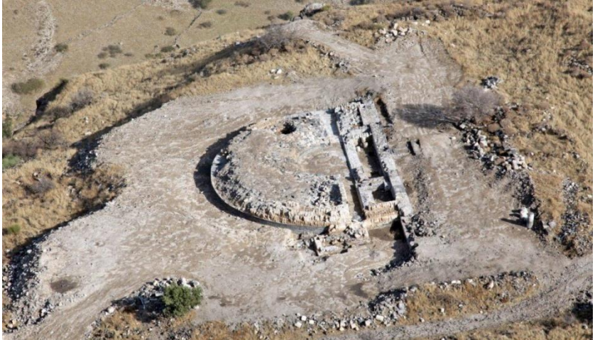
Рис. 2. Гиппос. Одеон. Аэроснимок.

- одеон – небольшая, крытая театральная площадка, которая использовалась в качестве места для декламации поэзии в сопровождении музыки.